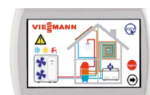
Comando Touch-Multi per il controllo in cascata fino a 7 unità