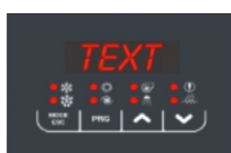
Comando a bordo macchina

Vitocal 100-A può essere gestita e monitorata dalla regolazione a bordo macchina e dai comandi ambiente Touch e Touch-Multi.